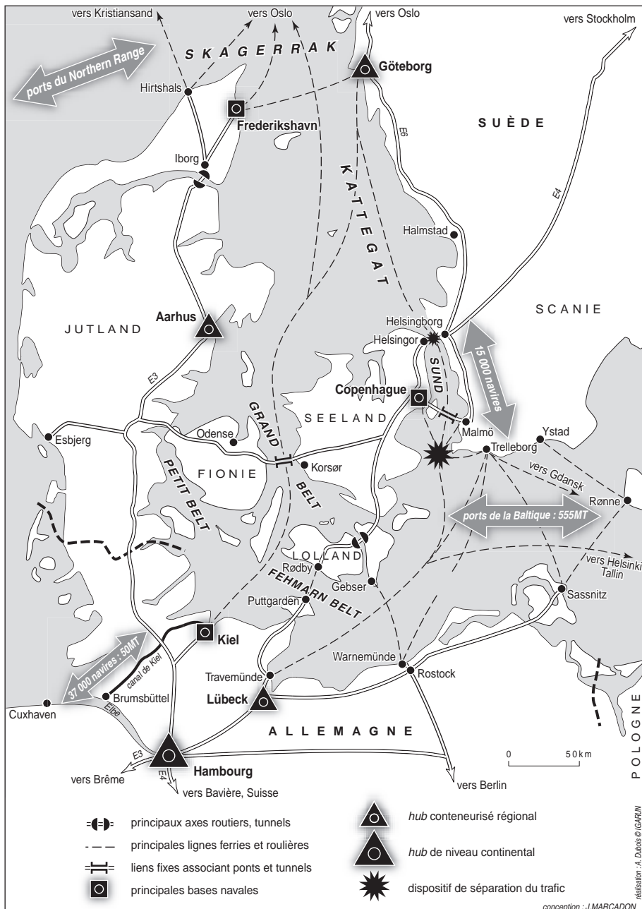
Figure 1 Les détroits danois, carrefour de l'Europe du Nord

En 1429, les Danois imposent un péage à tous les navires qui franchissent l'Øresund. Ils construisent en 1574 la forteresse de Kronborg à Helsingør (Elseneur), afin de contrôler la première route maritime européenne de l'époque: alors transitent dans les détroits, vers 1600, 5200 navires en moyenne par an. Le transfert