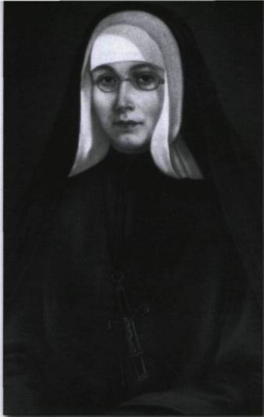
Mère Marie-Rose, née Eulalie Durocher (1811-1849), fondatrice des Soeurs des Saints Noms de Jésus et de Marie à Longueuil en 1843. (AEMVD 003).