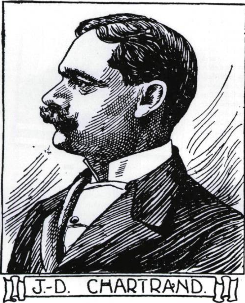
Portrait de Joseph-Damase Chartrand paru dans The Montreal Herald , le 26 avril 1901.