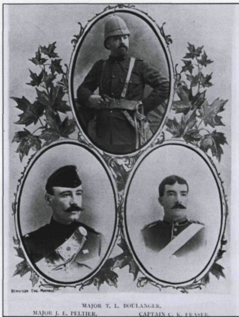
DENNISON ENG. MONTREAL

Le 30 octobre 1899, 1 500 volontaires canadiens (dont certains francophones) quittent le pays pour participer à la guerre des Boers, en Afrique du Sud. ( Le Mémorial du Québec , Tome IV, p. 871).