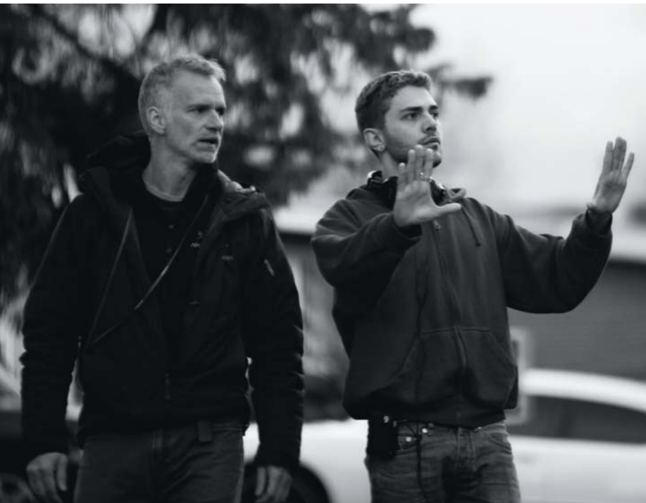
André Turpin et Xavier Dolan lors du tournage de Mommy