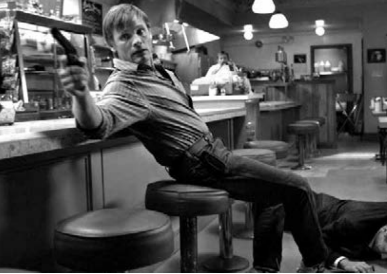
A History of Violence