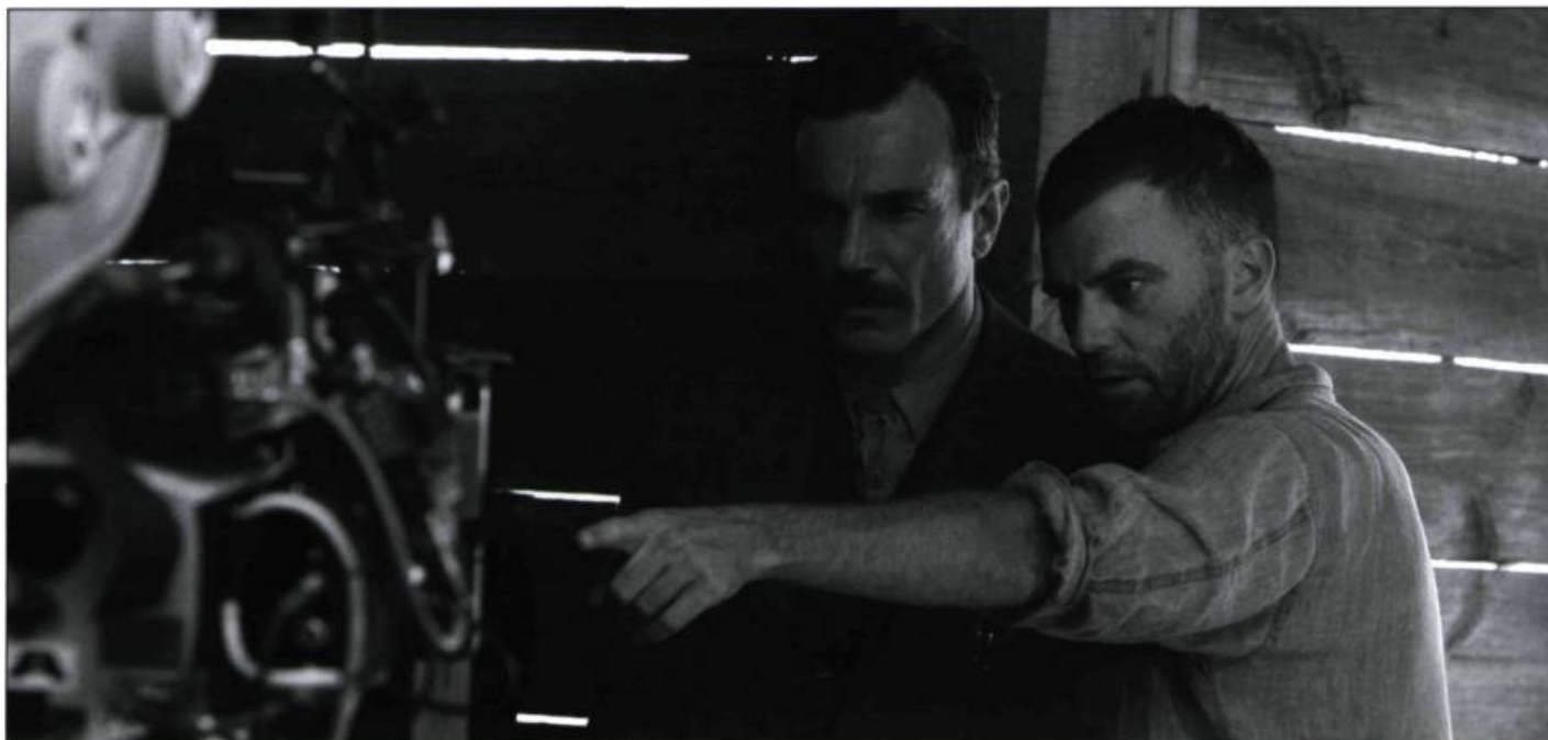
Daniel Day-Lewis et Paul Thomas Anderson pendant le tournage de There Will Be Blood

choc entre les deux principales religions américaines : le capitalisme et l'évangélisme. En effet, l'antagoniste de Plainview est un jeune pasteur du nom d'Eli Sunday. Les deux hommes partagent la même terre et luttent pour rallier le plus de membres à leur cause : l'un cherchant des fidèles et l'autre, de la main-d'œuvre. Ils se livrent aussi à un jeu d'humiliation très étrange, usant des symboles de leur institution comme armes. Après qu'Eli se fait enfoncer la tête dans une flaque de pétrole, il se venge en baptisant de manière musclée un Plainview particulièrement réticent. Le duel entre les deux hommes s'avère cependant inégal. Eli, malgré quelques apparitions remarquées, demeure un personnage marginal. Lors de leur confrontation ultime, Plainview le force à blasphémer sa religion, supplice auquel le pasteur se soumet dans l'espoir d'obtenir une compensation financière. Cette image d'un homme de Dieu, corrompu au point de rejeter momentanément sa foi pour de l'argent, manque sa cible puisque le degré de croyance du pasteur reste indéterminé. Dans Oil! , Eli est clairement un charlatan, usant de son église comme d'une entreprise. Anderson, pour une raison mystérieuse, refuse de se prononcer sur le sujet.