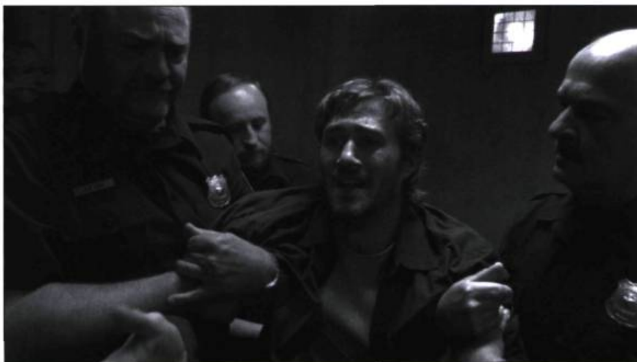
Manners of Dying