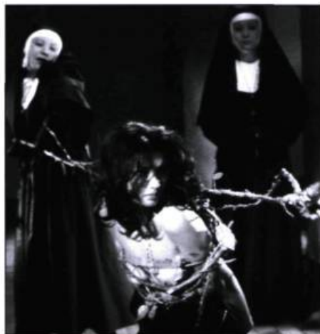
School of the Holy Beast

School of the Holy Beast demeure également un classique du cinéma d'exploitation japonais, c'est-à-dire un film qui s'insère dans un contexte prédéfini (un couvent, dans le cas échéant) tout en intégrant nudité, perversité et commentaires politiques. Force est d'admettre que pour intégrer ces différents éléments avec succès, il faut confier le travail à un réalisateur talentueux qui regorge d'imagination, et