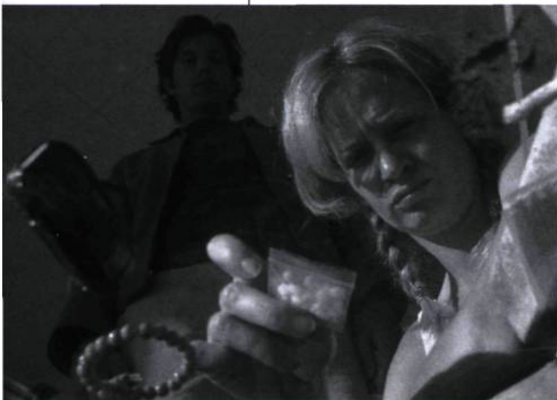
Des excès caricaturaux?

André Turpin: En fait, le rôle a été écrit avant que je sache qu'il allait le jouer. Ce n'était donc pas vraiment «pour» lui. Il faudrait lui en parler, car lui dit que le personnage ne lui ressemble pas du tout, que c'est une composition qui va entièrement à l'encontre de ce qu'il est. Je ne le connais pas beaucoup même si, comme tout le monde, j'étais au courant de sa réputation. Je sais surtout que, sur un plateau, c'est un acteur d'un sérieux impressionnant. Quand il est en tournage, il ne boit pas, ne fume pas, ne cruise pas: il fait des exercices, il mange des pâtes, il ne fait rien d'autre que lire son texte, préparer et répéter ses scènes, en ajoutant des variantes. En fait, il voulait tellement être bon qu'il lui arrivait de demander plus de prises alors que je savais que la troisième était bonne, ce qui peut être énervant quand on sait que le temps de tournage est compté. Mais notre relation de travail, bien que corsée, a