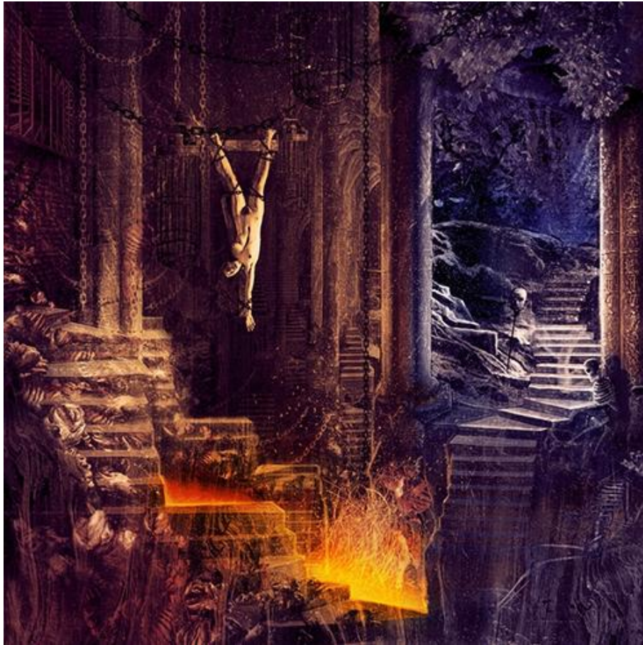
Stan-W Decker, Quatrième de couverture de The Uprising of Namwell (2017)

Illustration réalisée par ordinateur | 12,3 x 12,3 cm