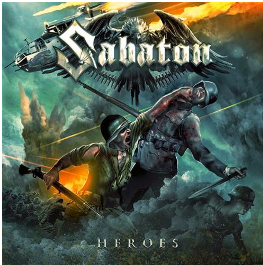
Péter Sallai, Couverture de Heroes (2014)

Illustration réalisée par ordinateur | 12,3 x 12,3 cm