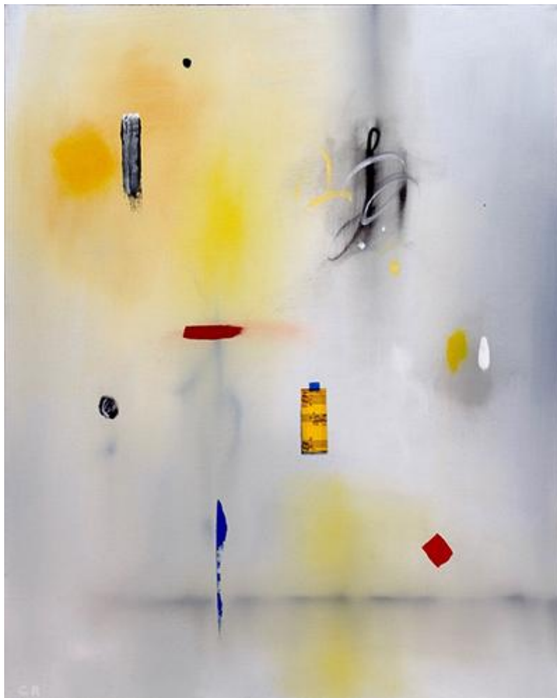
Curtis Ripley, Sonata #38 (2021)