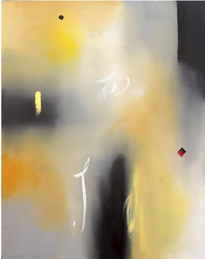
Curtis Ripley, Sonata #32 (2019)