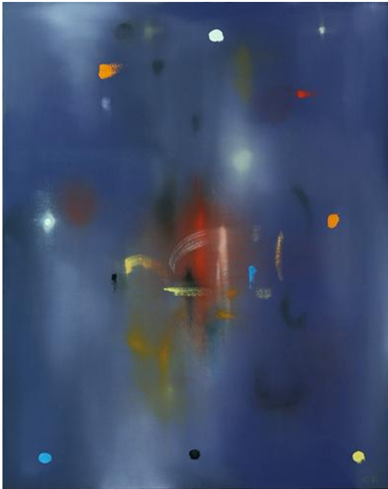
Curtis Ripley, Sonata #8 (2016)