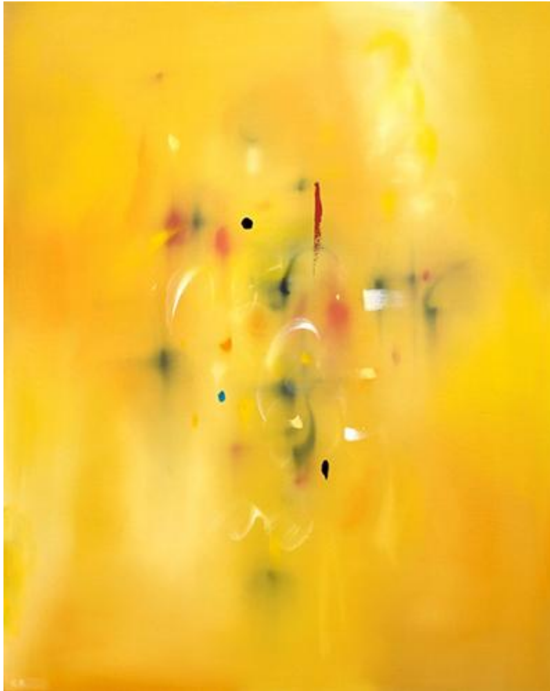
Curtis Ripley, Sonata #29 (2019)