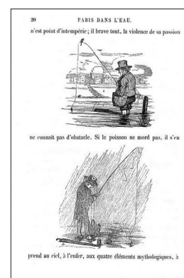
Figure 2 : Les pêcheurs de Paris dans l'eau par Bertall.