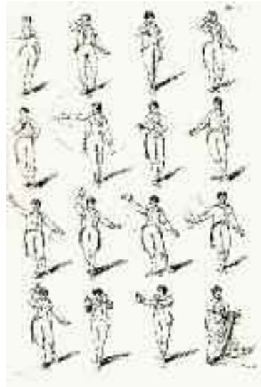
Austin, 1806 : IX, planche 9.

L'acteur en formation est appelé à se référer à des guides à l'intérieur desquels il est possible d'identifier certains préceptes relevant du maintien de la tête, du mouvement des yeux, des sourcils, de l'action des mains et de l'attitude d'ensemble du corps. Aussi existe-t-il au XVII e siècle des ouvrages présentant une série de prescriptions où le jeu codifié est comparable à celui de l'orateur, de l'avocat ou du prédicateur : la voix et la mimique étant soumises aux règles de la déclamation. Les ouvrages de Grimarest 4 (1659-1713), de Michel Le Faucheur 5 (1585-1657) et de René Bary 6 (16...-1680) soulignent l'influence considérable que les règles et les conventions de l' actio oratoire exercent sur l'orateur et le jeu de l'acteur. En somme, à cette époque, les fondements mêmes de l'art de l'acteur, se réclamant de savoirs et de codes associés à l'art de l'orateur, définissent et soulignent le dynamisme de l'interprétation.