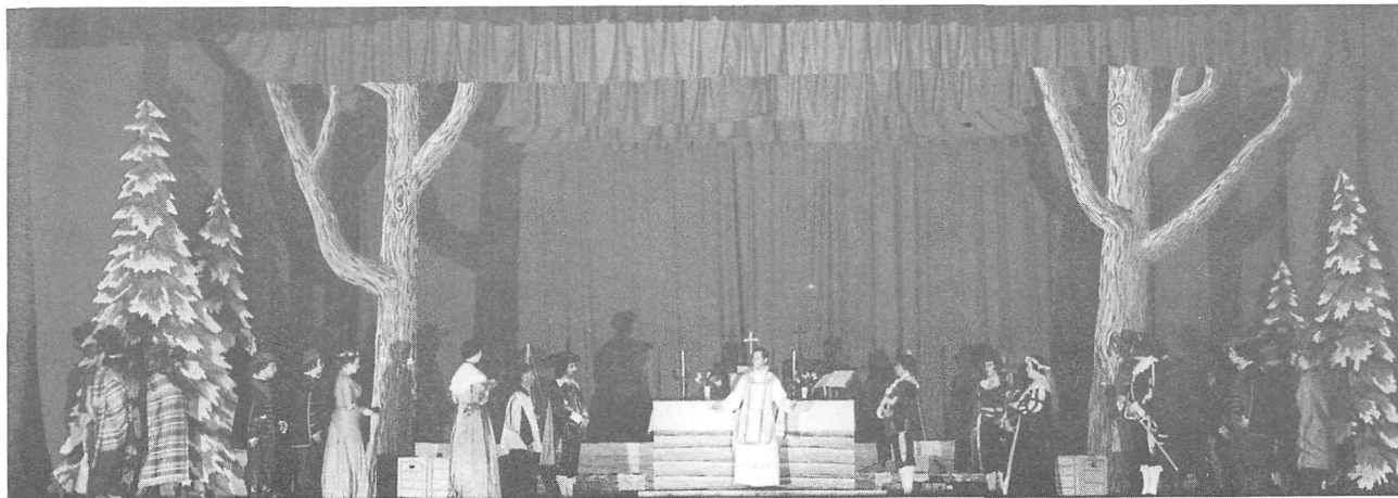
Tableau de la messe sur l'île de Montréal du Jeu de Celle qui étend son manteau d'un océan à l'autre de 1954.