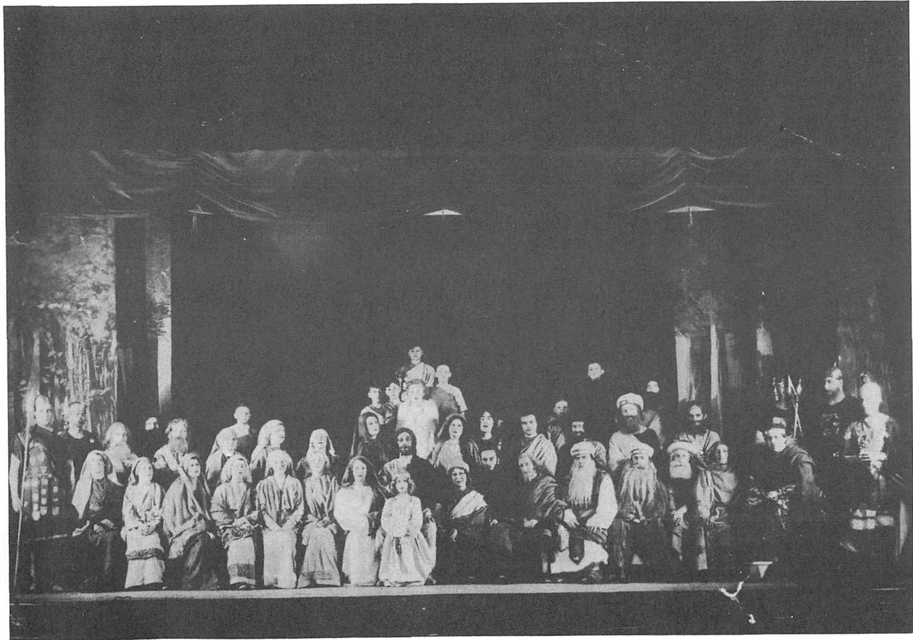
Personnages et figurants dans la Passion de Julien Daoust en 1933.