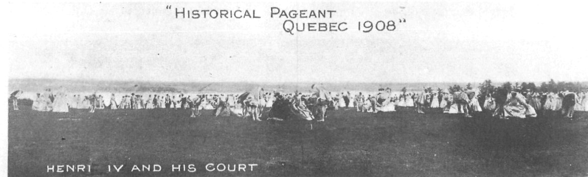
Tableau de «Henri IV et sa cour» du Pageant historique de Québec de 1908