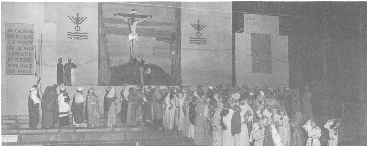
Scène du Pageant de la Vierge , à Arthabaska en 1953.