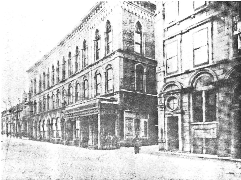
L'ACADÉMIE DE MUSIQUE vers 1900 Sur le côté, une affiche représentant James O'Neill (père d'Eugène) dans D'Artagnan.