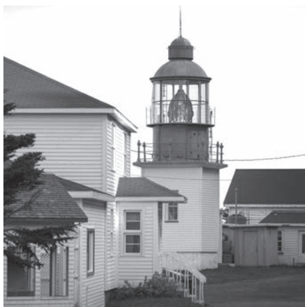
Le phare de Cap-Chat, construit en 1909, a conservé sa lentille de Fresnel.