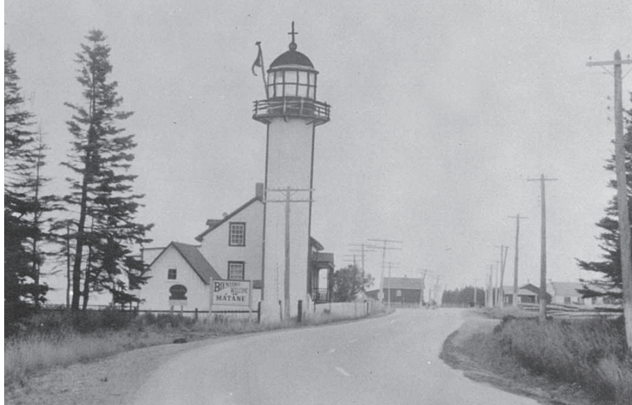
Le second phare de Matane construit en 1907.

Photo : Musée de la Gaspésie. Fonds Cornélius Brotherton. P141/1/9-11-1