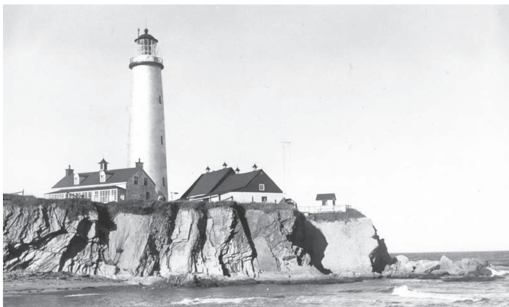
Du haut de ses 34 mètres, le phare de Cap-des-Rosiers demeure la seule tour impériale encore debout au Québec.

Tout au long du Régime français, l'administration coloniale ne disposait d'aucun budget pour développer un système d'aide à la navigation. En 1805, le gouvernement de la province du Bas-Canada crée une organisation appelée la Maison de la Trinité. Inspirée de la Trinity House de Londres, la nouvelle maison installée à Québec est chargée de l'établissement et de l'organisation d'un réseau facilitant la navigation et le commerce sur le fleuve. L'année suivante, la Maison de la Trinité de Québec accorde un premier contrat de construction pour le phare de l'île Verte. Mis en fonction en septembre 1809, ce phare sera la seule lumière sur laquelle les navigateurs pourront compter jusqu'en 1830.