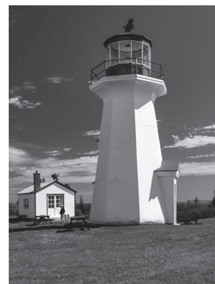
Au cap Gaspé, la maison de phare de bois de 1874 sera remplacée en 1950 par une tour de béton de forme octogonale.

Photo du phare de 1874 : Musée de la Gaspésie. Fonds Robert Fortin. P54/1b/5/42