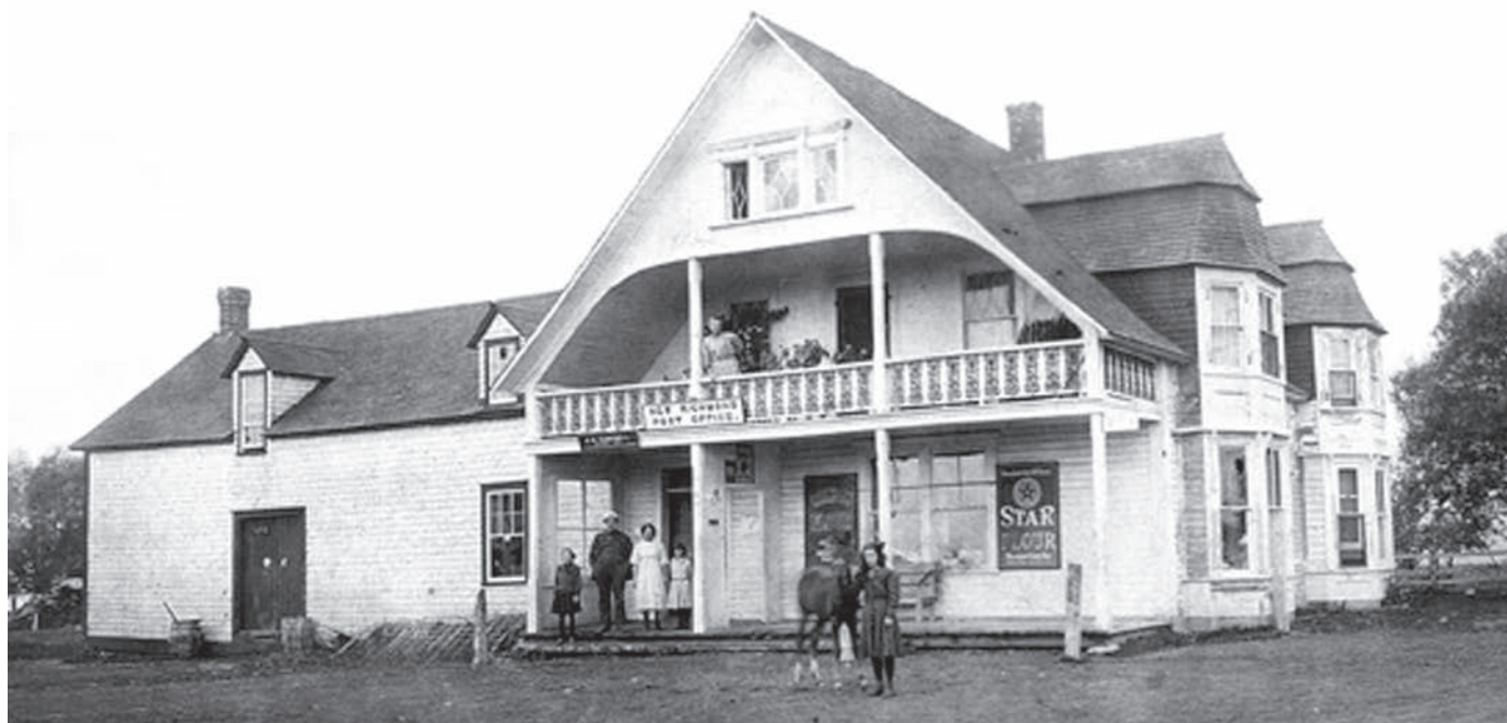
Magasin Campbell, 1910.