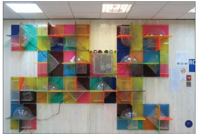
Vue d'ensemble de l'œuvre avant son démontage le 26 septembre 2011. Les dommages se sont accumulés au fil du temps.