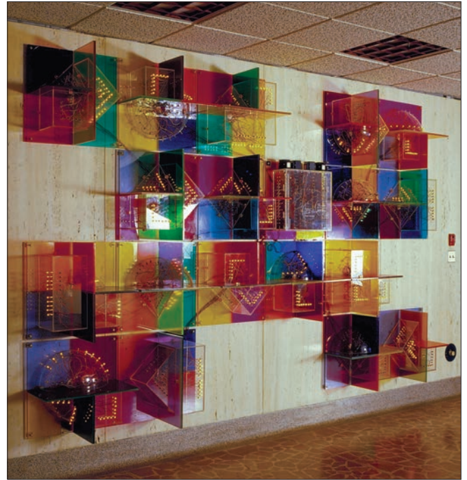
Cerveau III recherche une idée... , œuvre d'art public réalisée par Denis Poirier en collaboration avec le groupe Homo-Ludens, après son installation en 1975.

La restauration et la relocalisation de Cerveau III recherche une idée... soulèvent autant d'idées que de dilemmes. La restauration du « cerveau » s'avère particulièrement complexe. Ce