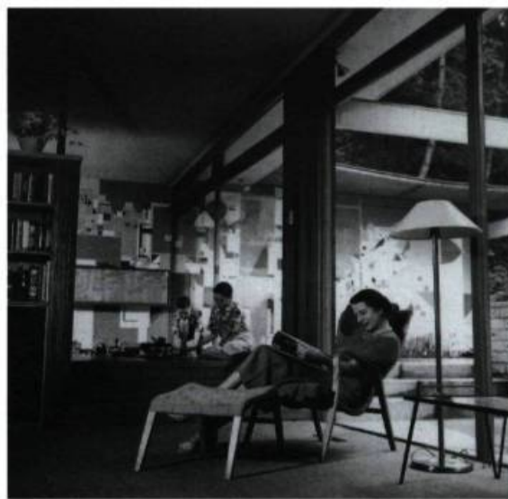
Graham Warrington, photographe; D.C. Simpson, architecte. Salle de séjour de la maison D.C. Simpson, West Vancouver, 1954. Avec la permission de Barry Simpson et Gregg Simpson. © 1997 Graham Warrington