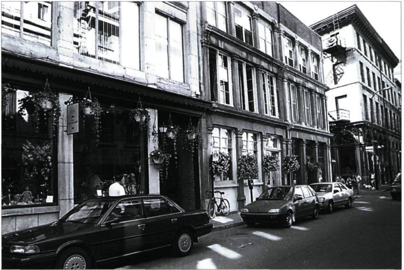
Commerces sur la rue Saint-Paul

d'affaires du Vieux-Montréal, a réussi à mobiliser une trentaine d'intervenants dans des projets d'amélioration des conditions d'affaires dans le quartier qui fut jadis le centre-ville de Montréal. Bref, ayant acquis une conscience plus aigüe des enjeux de développement du quartier, le milieu s'est pris en charge en respectant les exigences d'une concertation efficace.