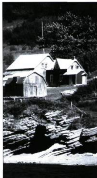
Le déplacement de la population entraîné par la création du parc Forillon a suscité de nombreuses réflexions sur la façon d'intervenir pour protéger la nature et les paysages québécois.