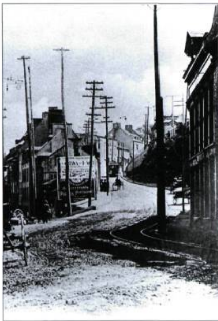
La côte d'Abraham à Québec vers 1900.

Heureusement, les bâtiments de la côte d'Abraham ont été épargnés. En 1992, ils étaient restaurés pour accueillir le complexe Méduse, regroupant divers organismes artistiques et culturels. Cette restauration marque la relance d'un développement plus respectueux des caractéristiques du quartier. Le plan de revitalisation prévoit plusieurs étapes dans une vision à moyen et à long terme, la seule acceptable lorsqu'il est question d'aménagement urbain.