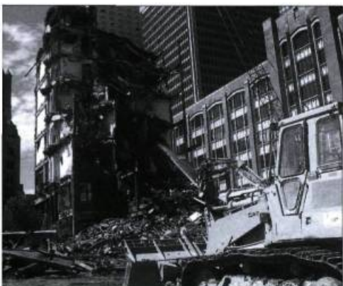
La destruction de l'hôtel Queen à Montréal ainsi que celle de nombreux autres bâtiments, dans un contexte de développement urbain échevelé, marquent la ville de façon indélébile.