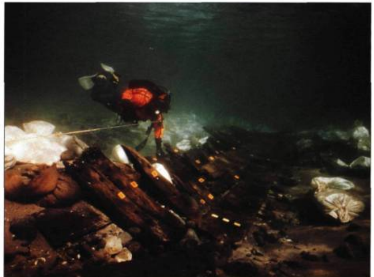
Le sauvetage de l'épave de la flotte de Phips aura permis d'associer la population locale à un formidable effort de conservation des vestiges.

La conservation et la restauration des vestiges vont requérir plusieurs années de travail. Les recherches des archéologues, des historiens et des spécialistes en culture matérielle permettront de mieux connaître l'expédition militaire de Phips contre Québec, la vie à bord du navire, l'architecture navale ainsi que la vie en Nouvelle-Angleterre à la fin du XVII e siècle. Ce projet est exemplaire en raison notamment de la mobilisation de la communauté locale, de l'engagement des bénévoles du Groupe de préservation des vestiges subaquatiques de Manicouagan (GPVSM) et de la concertation entre les divers paliers de décision.