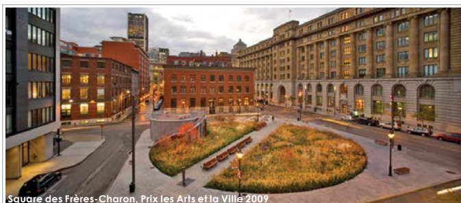
Square des Frères-Charon, Prix les Arts et la Ville 2009