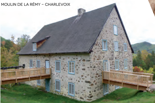
MOULIN DE LA RÉMY - CHARLEVOIX

Ces témoins du passé prolongent la vie des disparus. « C'est comme s'ils restaient un petit peu avec moi », formule celle que sa passion a conduite au métier d'archiviste. Ce coffret à