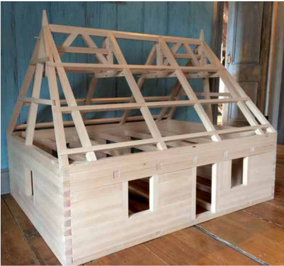
Représentative de l'architecture française, la maquette de la maison Bégin compte 155 morceaux.