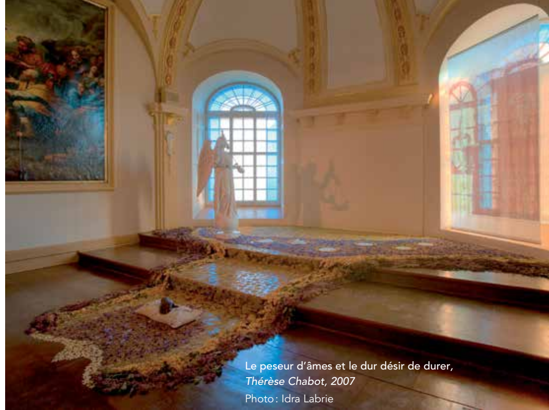
Le peseur d'âmes et le dur désir de durer, Thérèse Chabot, 2007

Certains créateurs trouvent quant à eux leur inspiration dans les éléments patrimoniaux eux-mêmes. Interpellée par le caractère sacré de l'église de Deschambault et par l'Ange peseur d'âmes de Louis Jobin, Thérèse Chabot, de Saint-Jean-Baptiste-