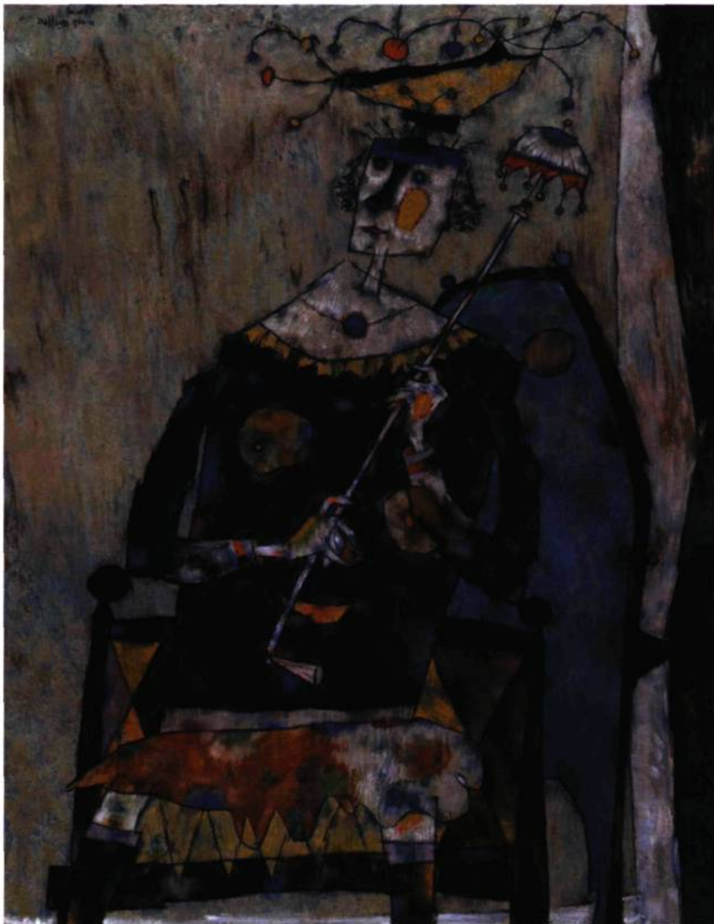
Bossue à l'ombrelle 1960-1961 Huile 116 x 69 cm