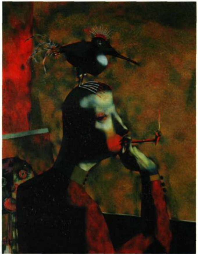
L'homme à l'oiseau , 1955 Huile 81,3 x 63,5 cm

Enfin, il est possible de rapprocher Bossue à l'ombrelle (huile) de Personnage ludique (technique mixte), œuvres toutes deux réalisées en 1961. Au-delà des éléments communs aux deux œuvres (ombrelles miniatures tricolores,