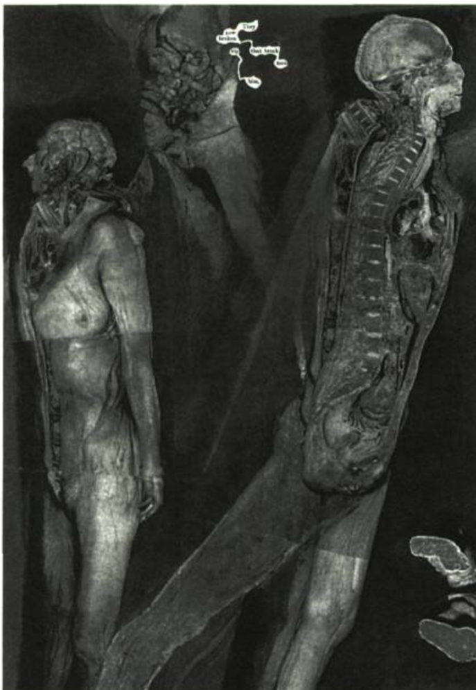
Dante's Inferno (extrait) de Tom Phillips, 1985