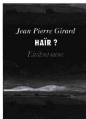
Haïr ? Jean-Pierre GIRARD Nouvelles 167 pages, 19,95 $