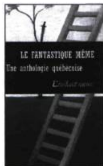
Le fantastique même Une anthologie québécoise Anthologie rassemblée et présentée par Claude GRÉGOIRE 238 pages, 14,95 $ POCHÉ