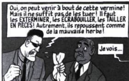
Red Ketchup contre Red Ketchup, par Réal Godbout et Pierre Fournier