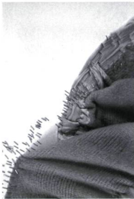
Elana Herzog, Untitled # 12 , 1996. Couverture rose en polyester, élastique, agraffes. (détail).

mêmes gardant une mémoire qui leur est inhérente pouvaient parler, mais n'avaient pas seuls la parole. Quelque chose se trame. Bien sûr, il s'agit de tissage, de réseaux, de motifs, de malléabilité... et je pourrais moi-même broder sur nombre de thèmes que ces réalisations artistiques suggèrent.