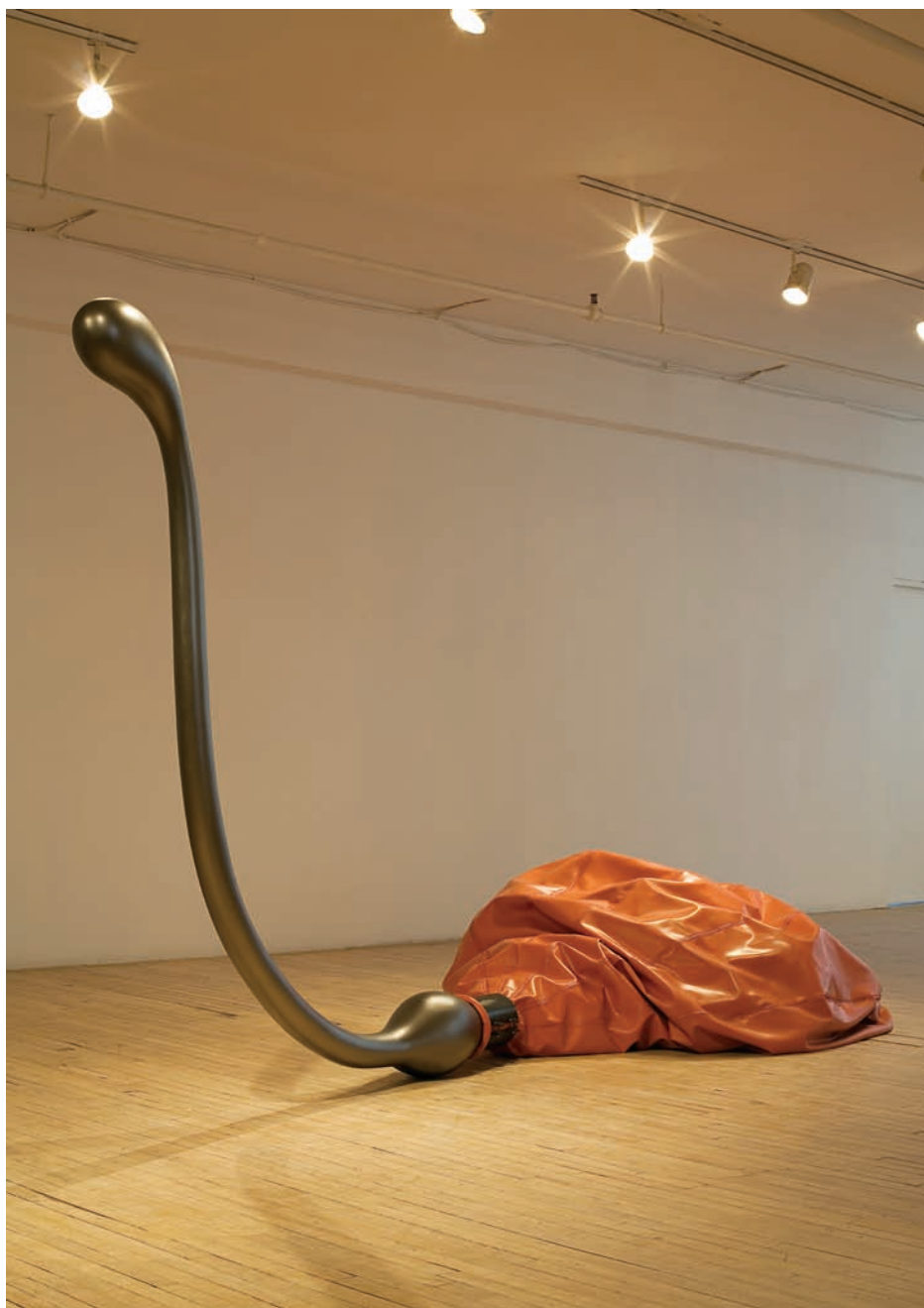
Liliana BEREZOWSKY, Cygnus , 2010. Sculpture. Caoutchouc, silicone, bois, graphite, acier. 199,5 x 425 x 160 cm (variable).