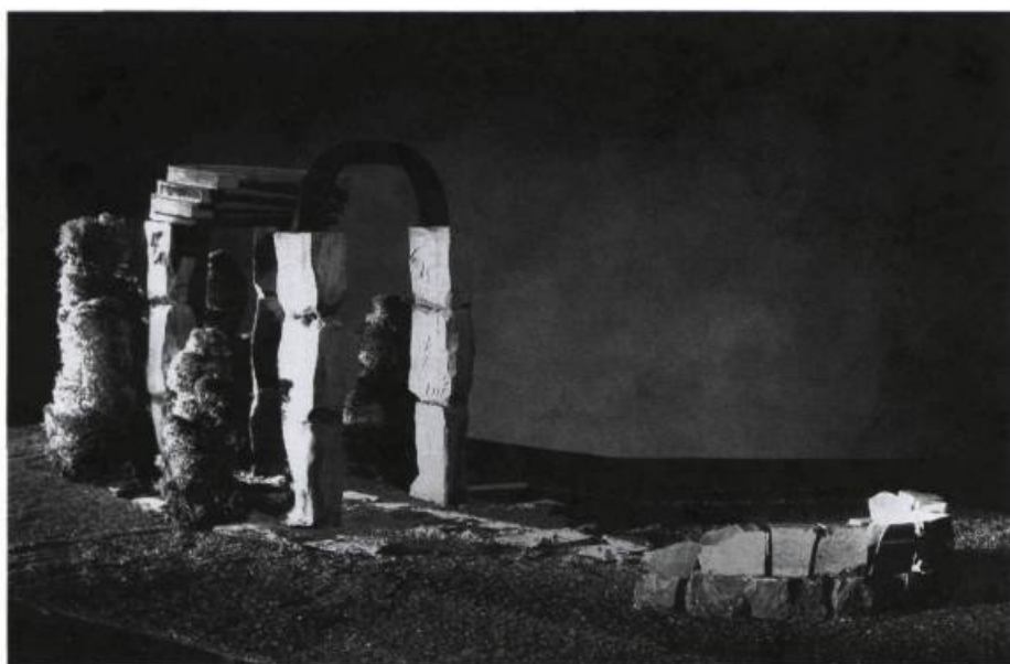
Rose-Marie Goulet, Phrases-Sculptures , 1992. Béton, acier, contreplaqué. Maquette de l'oeuvre qui sera réalisée au Vieux-Port.