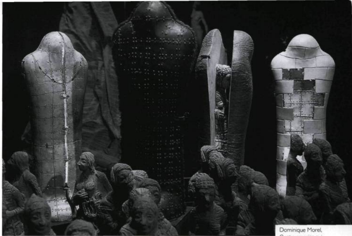
Dominique Morel, Quatre momies qui s'ouvrent , 1996. Matériaux mixtes.

différente, représentant différents modes de libération. Celle en cuir et fourrure, c'est la cage dorée, confortable à l'intérieur, tandis que l'extérieur bouloigné, vissé comme dans la chair, fait penser à quelque chose d'étouffant, tel un carcan ou un élément de torture. La momie en corde recèle un personnage — la figure-furie conçue par Violette Dionne —, qui semble hurler et se débattre pour s'évader de cette prison qui l'enserme. La troisième est un mur en forme