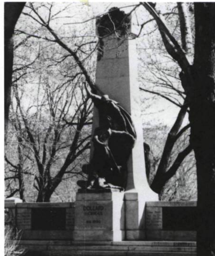
Alfred Laliberté, Monument à Dollard des Ormeaux, 1920. Parc Lafontaine, Montréal.

Autre trait commun : le recours à la figuration. Un retour de plus en plus marqué ces dernières années, après plusieurs années de sculpture publique majoritairement abstraite. Dans la pièce du square Berri, le motif prélevé de l'architecture est reconnaissable et cela, malgré qu'il "transpose" en à-plat, sans profondeur, ce qui au départ constituait une masse, un volume plein. Les pans d'édifices s'élèvent tel un dessin en deux dimensions sculpté dans l'espace. Un dessin ou une photographie puisque le motif montré, à l'instar de celui révélé sur une photo, témoigne d'une appropriation, indique un "ça-a-été" noté par Roland Barthes. Installé devant la pièce, le spectateur, en détournant la tête, reconnaîtra dans les édifices avoisinants la "réalité" première qui a précédé et engendré l'oeuvre : la sculpture désormais entendue comme un écho. ♦