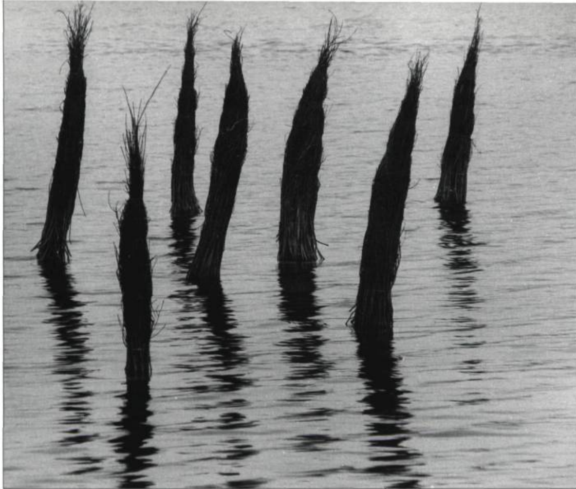
Danyèle Alain, Zone 0/0 Zone, 1994. Installation. Comus, stolonifère, encausti- que, bois / Stolonate, encaustic, wood.

le dernier orme disparaîtra de la surface du globe, des bouleversements profonds surgiront sur terre. Son installation cherche à reconstruire l'orme, mais elle le fait d'une manière fragile et précaire, comme pour illustrer les difficultés de notre société à mener à bien les grands projets de changements.