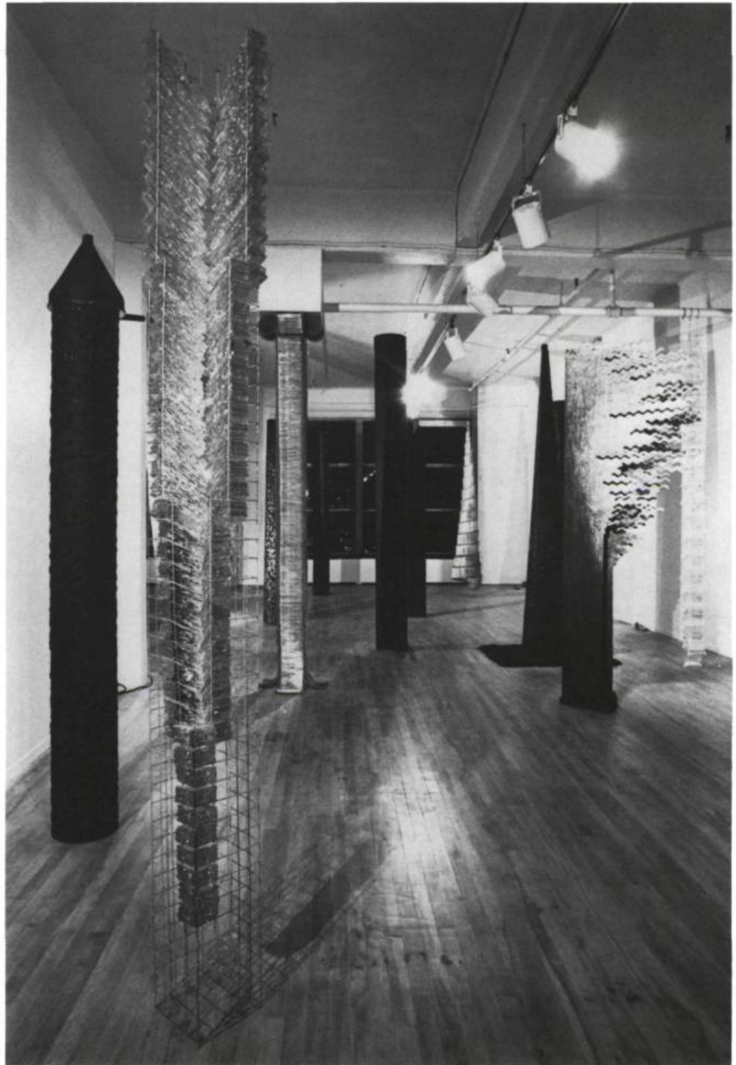
Vue de l'exposition Verticalités , Galerie Trois Points, 8 octobre-2 novembre 1988.