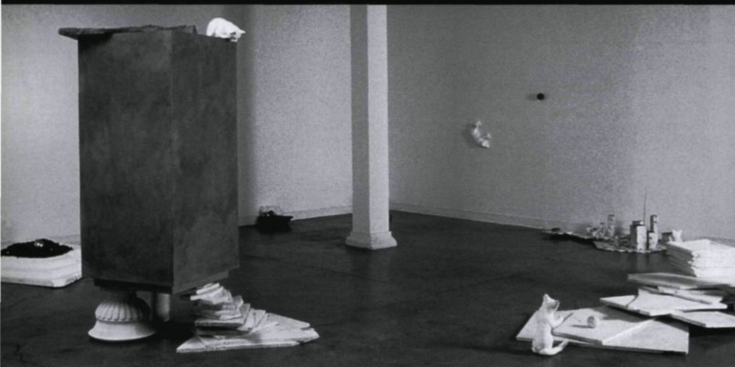
Claude Mongrain, Paysage avec monument , 1989. Plâtre, bois, marbre, mousse de polystyrène, pierre, objets, radio à transistor, 6 m diam. Galerie Christiane Chassay.

Depuis les bas-reliefs cubistes jusqu'aux installations postmodernes, en passant par la sculpture ouverte, la sculpture cinématique, la sculpture linéaire, la sculpture objet, etc., le domaine de la sculpture au XX e siècle a été marqué par la multiplicité et la nouveauté des formes sous lesquelles l'objet sculptural s'est présenté. Cette diversité a contribué tout au long de ce siècle à mettre en question de façon incessante la définition de la notion de sculpture. L'une des plus récentes réflexions théoriques importantes à ce sujet, bien qu'elle remonte déjà à une quinzaine d'années, a été mise au point par Rosalind Krauss dans son fameux texte Sculpture in the Expanded Field . 1