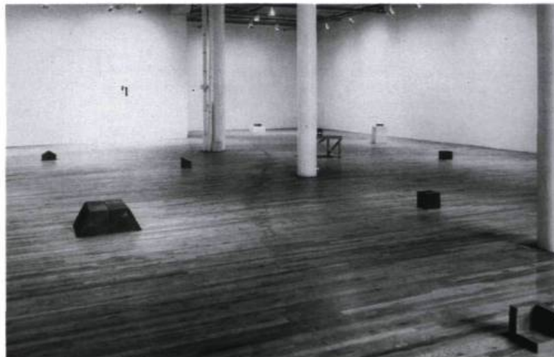
Joel Shapiro, Sans titre, 1975. Installation d'édicules en fonte et en plâtre.

des transformations de perspectives dues aux changements de points de vue du spectateur, ils soutiennent que «dans l'oeuvre d'art tridimensionnelle [le temps] est manifeste à cause du mouvement du spectateur autour de l'oeuvre» 18 . De là, ils conviennent que la perception de la sculpture se déroule dans le temps.