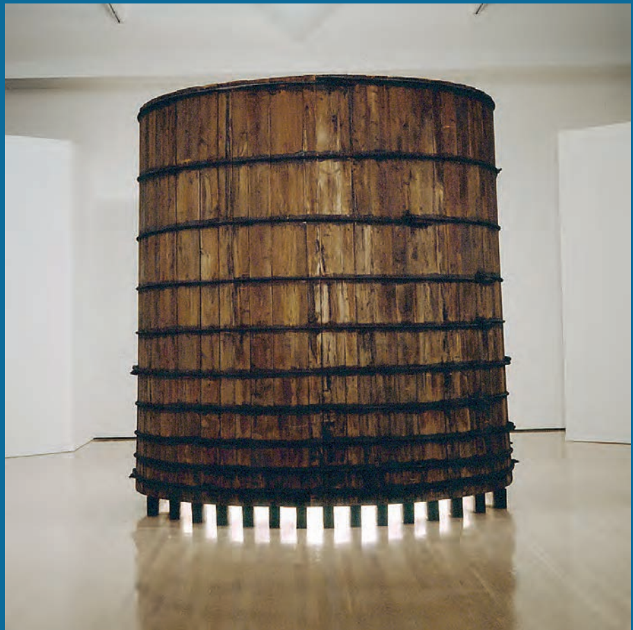
Irene F. WHITTOME, Château d'eau, lumière mythique , 1997. Bois de cèdre, métal, miroirs, défenses de narval en ivoire, moteur et lumière / Cedar, metal, mirrors, narwal ivory defenses, motor and light. 320 x 305 cm (diam.). Collection Musée d'art contemporain de Montréal. ©Irene F. Whittome / SODRAC (2012).