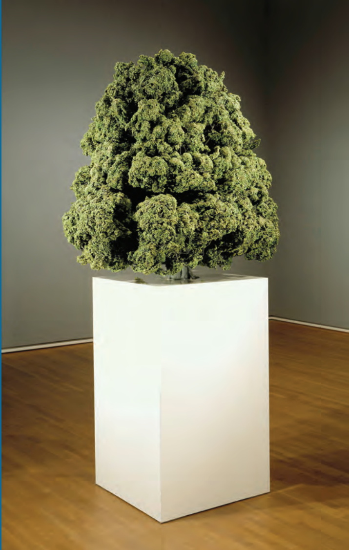
Martin HONERT , Tilleul , 1990. Métal, mousse synthétique, résine plas- tique, papier, peinture. 145 x 140 x 140 cm. Coll. Musée des beaux-arts de Montréal.