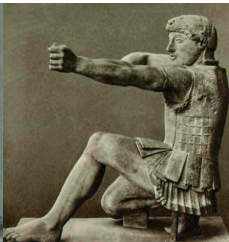
Héraclès. Fronton du Temple d'Aphaïa à Égine (500-490 av. J.-C.). Pediment from the Temple of Aphaia in Aegina. Restoration/Restoration: Bertel THORVALDSEN. Glyptothèque, Munich.