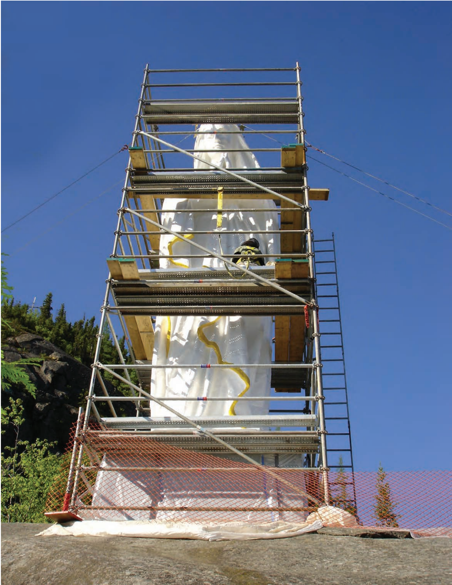
Louis JOBIN, La Madone du Saguenay , 1881. Une vue générale de la statue en cours de traitement avec l'échafaudage à quatre paliers donnant aux restaurateurs accès à toute la surface./An overall view of work on the statue with four-storey scaffolding to give the restorers complete access.