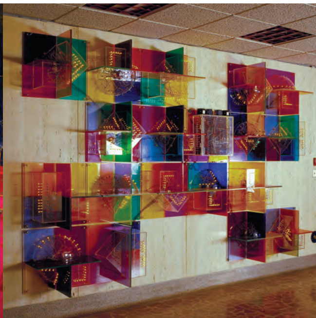
← Denis POIRIER (collaboration: Homo-Ludens), Cerveau III recherche une idée , 1974. Vue d'ensemble/General view. Palais de justice de Salaberry-de-Valleyfield.