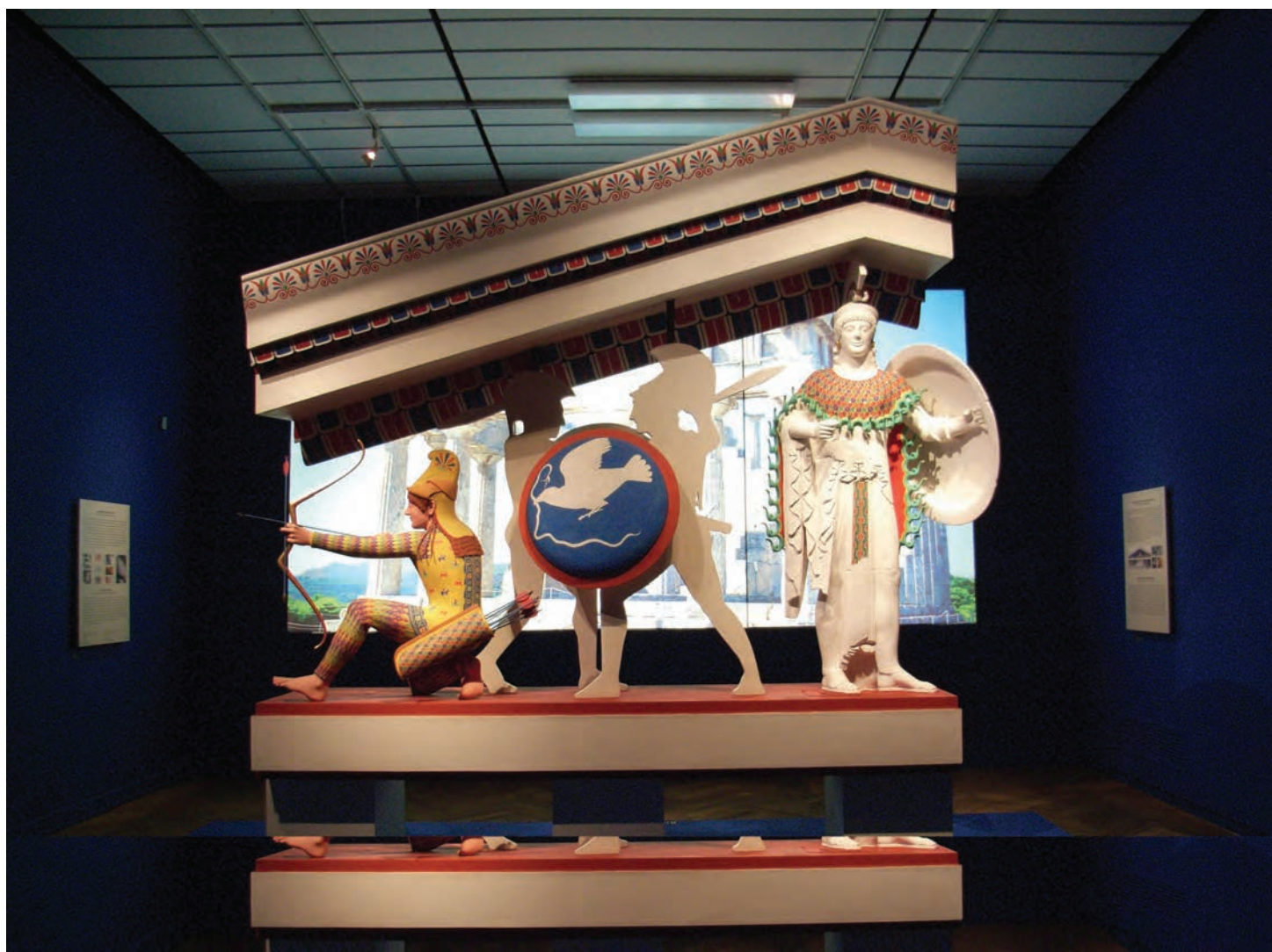
Reconstitution polychrome du fronton du temple d'Aphaia à Égine. Détail de l'exposition Bunte Götter. Die farbenfrohe Welt der Alten Griechen , Musée d'art et de l'industrie à Hambourg, 4 avril – 1 er juillet 2006. / Reconstruction of the polychrome pediment of the Temple to Aphaia in Aegina. Detail in the exhibition Bunte Götter. Die farbenfrohe Welt der Alten Griechen , The Museum of Art and Industry in Hamburg, April 4 – July 1, 2006

At the international level, UNESCO has a programme that attends to preserving at-risk cultural property. In 1954, following World War II's massive destruction, member states adopted the Protocol to the Convention for the Protection of Cultural Property in the Event of Armed Conflict . It is “the first international treaty with a worldwide vocation focusing exclusively on the protection of cultural heritage in the event of armed conflict. [...] A review of the Convention was initiated in 1991, resulting in the adoption of a Second Protocol to the Hague Convention in March 1999.” 8 At the time of writing this, the organization is completing a pilot project—financed by the United States—to document and catalogue the collections of the Kabul Museum and to restore the objects destroyed