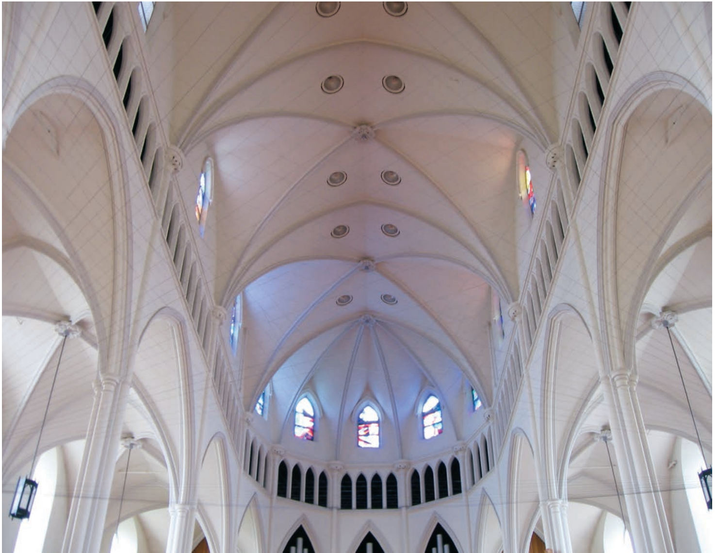
Martin BOISSEAU, Neuvième temps: excédent vide (version deux: Grand blanc haut/ Mince noir long), 2006. Rubans vidéographiques étirés et déployés dans la cathédrale Saint-Germain de Rimouski/ Unwound videotape installed at St. Germain Cathedral in Rimouski.