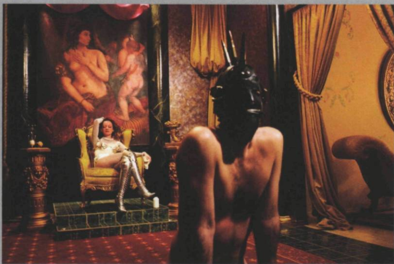
Pandora's Box, Mistress Catherine after the whipping I, The Versailles Room, New York, City, 1995

of Meisela's photos, boxed and heavily laden with interleaved sheets of "Lee colour-filter mirror silver 271," "Caliper 1 mm. natural rubber grade S," "Polyurethane-coated 100% polyester interlock," and other matrices of artificiality, was published by the German firm Trebruk in an edition of 1,650 copies.