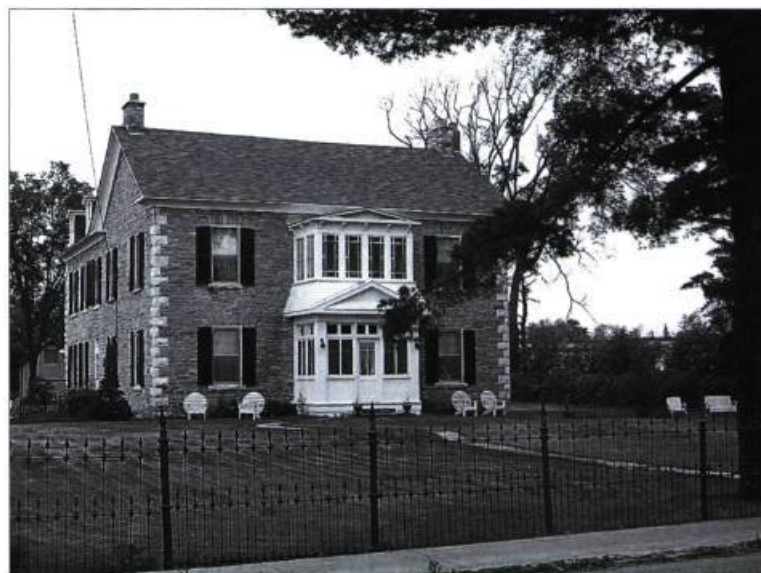
Maison Bryson-Toller à Fort-Coulonge, vers 1985.

Insister sur ce qui différencie l'Outaouais du reste du Québec est susceptible de nous piéger dans notre appréciation du patrimoine de l'Outaouais. Si celui-ci est marqué par la cohabitation d'ethnies et de confessions diverses, il l'est encore plus par le rôle dominant des Canadiens français et des catholiques dans le développement de la région. Même si la toponymie de l'Outaouais, comparée à celle du reste du Québec, se distingue par la fréquence des noms anglais et la rareté des noms de saints, elle ne nie pas pour autant la prédominance canadienne-française. Et il en va de même pour la culture matérielle. Qu'il