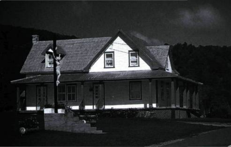
Maison et croix de chemin sur la rive est du lac L'Escalier, vallée de la Lièvre vers 1975.