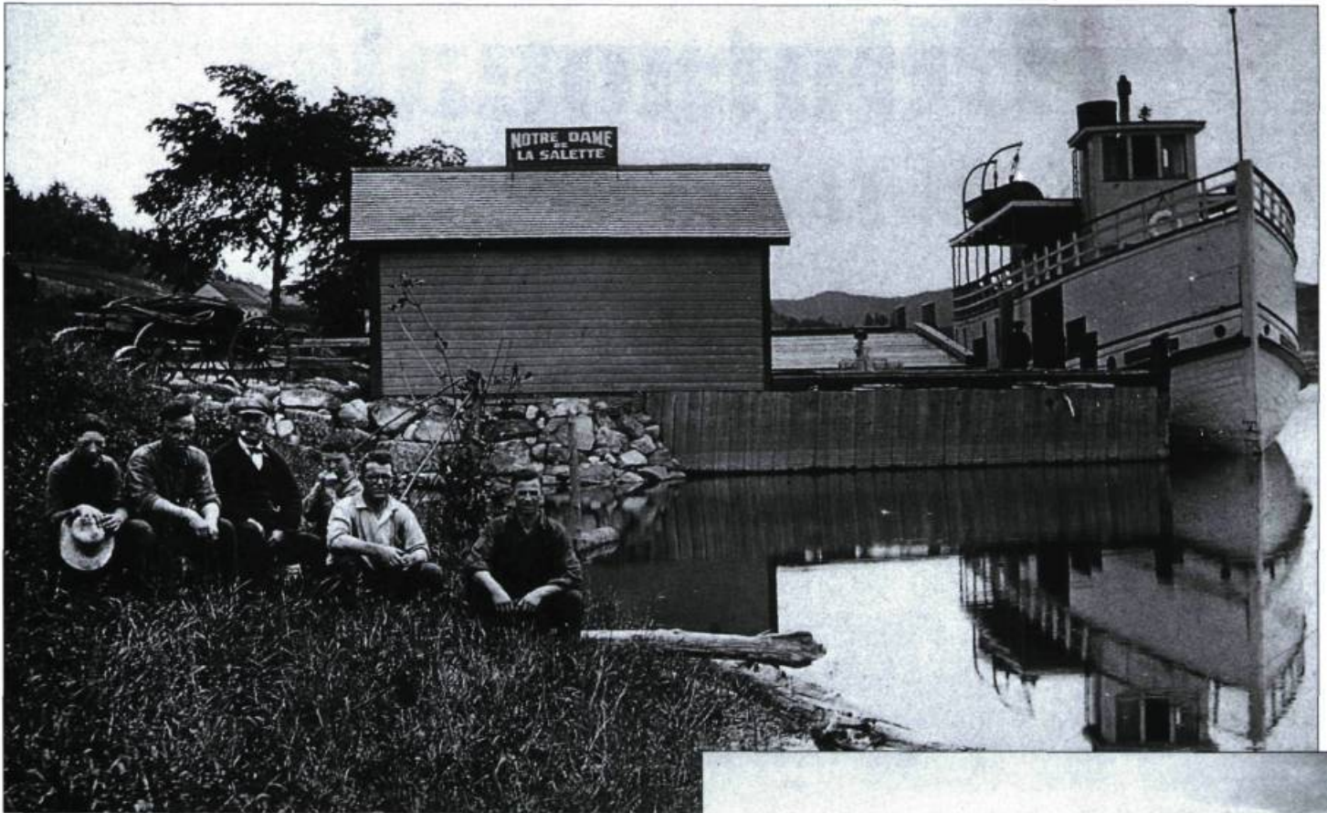
Le vapeur George-Bothwell au quai de Notre-Dame-de-la-Salette, sur la rivière du Lièvre, vers 1924.