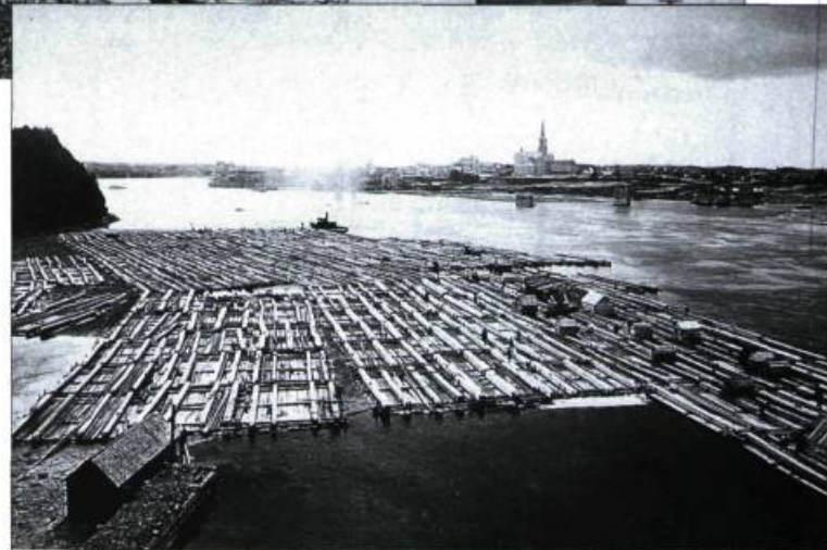
L'un des derniers grands radeaux de bois équarri à descendre l'Outaouais. À l'arrière-plan, la ville de Hull et les piliers du pont Royal-Alexandra en 1900.

La rivière des Outaouais a marqué toute l'histoire de la région. Dès l'époque de Champlain, c'était la principale voie de pénétration vers les Grands Lacs, un raccourci emprunté par tous les grands noms de l'histoire du Canada jusqu'au milieu du XIX e siècle, par les voyageurs, traiteurs, missionnaires, Amérindiens et militaires qui empruntaient les sentiers de portage de la rive nord en direction de Mattawa, du lac Nipissing, de la rivière aux Français et de la baie Georgienne. C'était la route de l'Ouest et des « Pays d'en haut ».