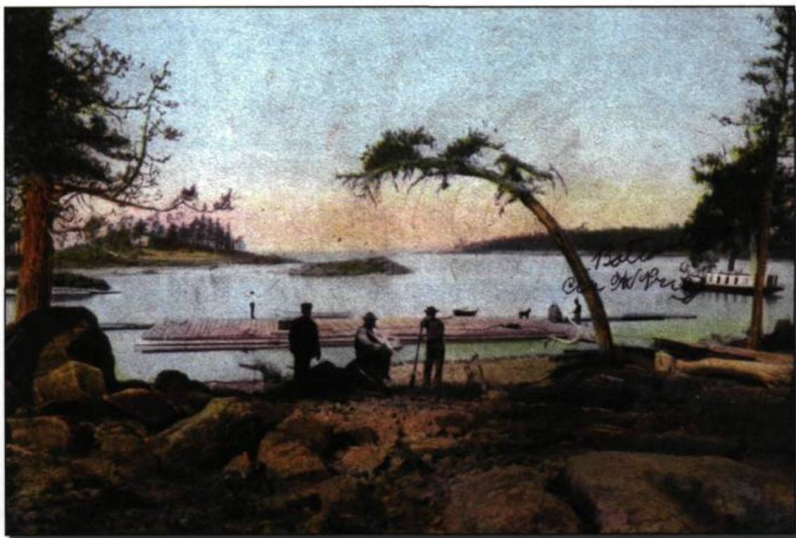
Bateau à vapeur appartenant aux Price sur la rivière Grande Décharge au Lac-Saint-Jean, vers 1888. Carte postale Montreal Import Co. d'après une photographie de Jules-Ernest Livernois. (Collection Jacques Saint-Pierre).

Price ne met pas longtemps avant de se lancer dans l'autre grande industrie de Québec, la construction navale. Entre 1820 et 1850, environ 40 bateaux sont enregistrés sous son nom ou sous celui de ses associés, à Québec, Montréal, sur la rive sud et dans le Haut-Saint-Laurent, incluant des barques, des bricks, des trois-mâts et des goélettes. On dit qu'il a lui-même tâté de la construction navale à l'anse Hadlow : les registres montrent qu'il a engagé un apprenti constructeur juif de seize ans, Seixas Jos, en 1825. Price affrète ses propres goélettes, la Marie-Catherine et la Charlotte pour le transport de mar-