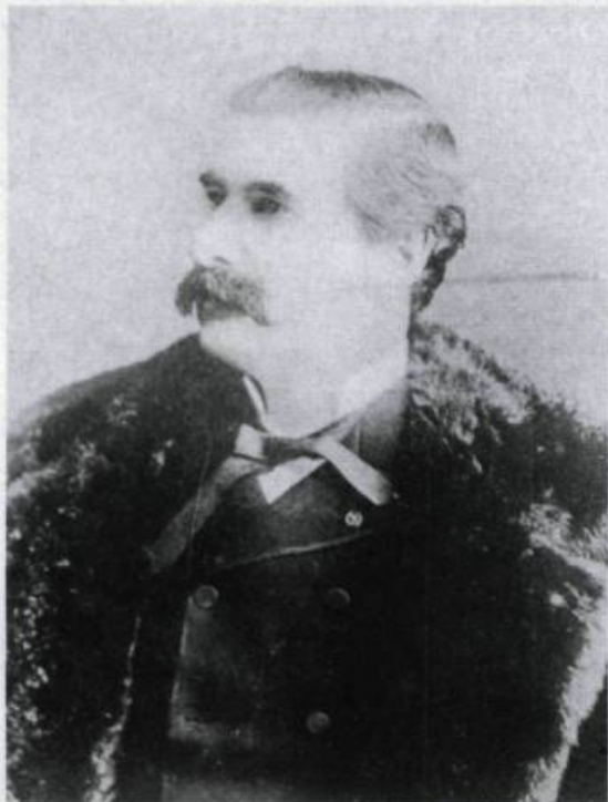
Honoré Mercier (1840-1894). À la tête de son parti national, Mercier remporte par une faible marge les élections d'octobre 1886 et devient premier ministre le 20 janvier 1887.

pourquoi elle souda pendant plusieurs années les énergies populaires au Québec.