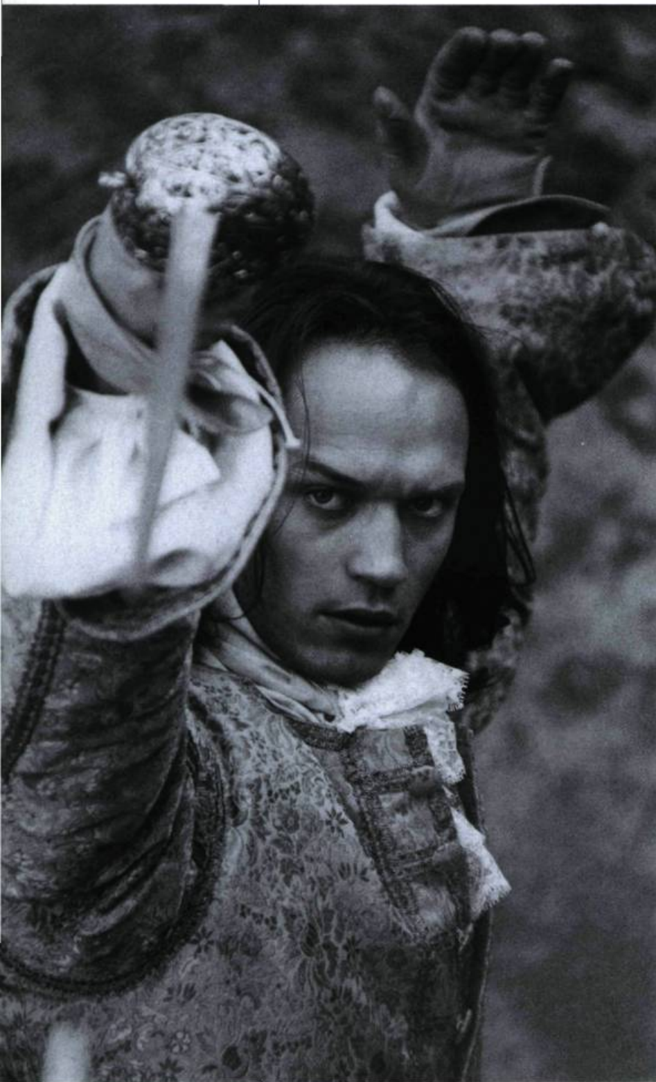
Vincent Perez dans le Bossu de Philippe de Broca

me faire Depardieu! De toute façon, il a travaillé avec un peu n'importe qui! Pourquoi Depardieu, avec sa tête de boucher et son grand menton est-il une star? Et Auteuil, avec son nez tordu... J'adore Daniel, je l'ai connu à ses débuts, et je me disais: celui-là, il n'y arrivera jamais, il fera les comiques. J'ai pensé la même chose de Belmondo d'ailleurs.