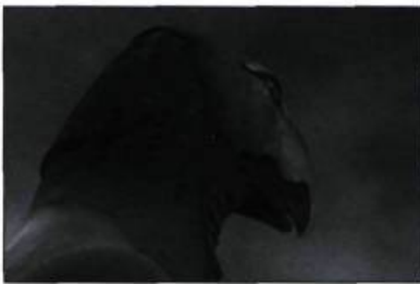
Le dieu à tête de faucon Horus en quête de son immortalité dans Immortel (ad vitam)

Maître incontesté du neuvième art, Bilal est longtemps resté l'enfant incompris du septième. Depuis qu'il a réalisé les décors de La Vie est un roman d'Alain Resnais, en 1982, et fait des recherches graphiques pour Le Nom de la rose de Jean-Jacques Annaud, en 1985, le bédéiste s'entête à vouloir conquérir le grand écran. Supportés par de modestes moyens financiers, mais par de solides castings, deux premiers films voient le jour dans lesquels Bilal signe à la fois le scénario original et la réalisation. Bunker Palace Hôtel (1989), avec Jean-Louis Trintignant et Carole Bouquet, est une fable futuriste illustrant le séjour de dignitaires dans un luxueux abri souterrain durant une révolution. Dans Tykho Moon (1996), film atypique qui mettait aussi en vedette Julie Delpy et Marie Laforêt, Michel Piccoli incarne un dictateur illuminé ayant recréé Paris sur la Lune et essayant d'échapper à la mort en s'emparant des cellules d'un amnésique.