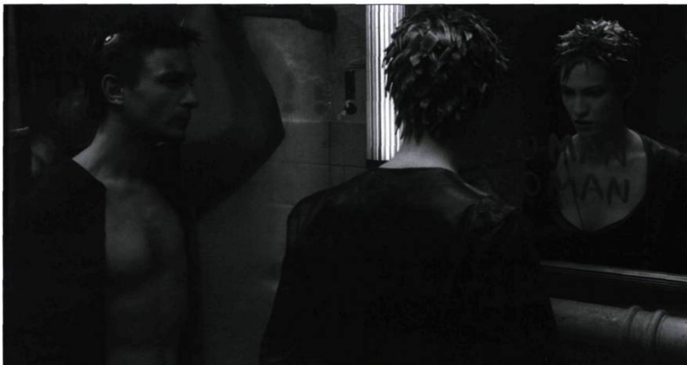
Alcide Nikopol (Thomas Kretschmann) dans la salle de bain de Jill (Linda Hardy) au Western Hysteria Hotel

ressortie au moment où j'ai fait Nikopol en bande dessinée et qui colle tout à fait au personnage. Il était naturel pour moi que les premiers mots que Nikopol se rappelle au moment où ses neurones se mettent à décongeler sur le pont de Manhattan, soient les vers du poème Une charogne .