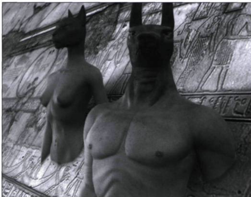
Les divinités égyptiennes Bastet et Anubis que la disparition de Horus inquiète

C'était un échec parce qu'aujourd'hui c'est le nombre d'entrées qui fait l'échec ou le succès d'un film. Sur le plan artistique, je considère que c'est un film maîtrisé. Je l'assume parfaitement de ce point de vue-là. C'est un échec, parce qu'il a été distribué dans des conditions difficiles. Aucun