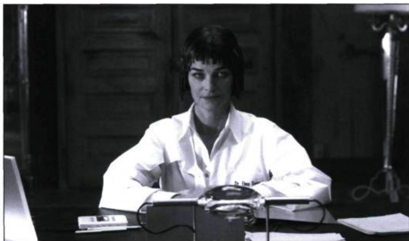
Une résistante du futur : le D' Elma Turner (Charlotte Rampling) de la firme Eugenics

Dans cette œuvre que j'ai dû tourner en anglais pour répondre aux exigences des coproducteurs japonais et coréens et pour faciliter la distribution internationale, Baudelaire est un cheval de Troie, un clin d'œil à la culture française. C'est le poète qui m'a impressionné le plus et le plus tôt dans ma toute nouvelle maîtrise de la langue française, que j'ai apprise à partir de l'âge de 10 ans. J'ai trouvé une espèce de folie dans les mots de Baudelaire, une façon de dire les choses, une sensation qui est