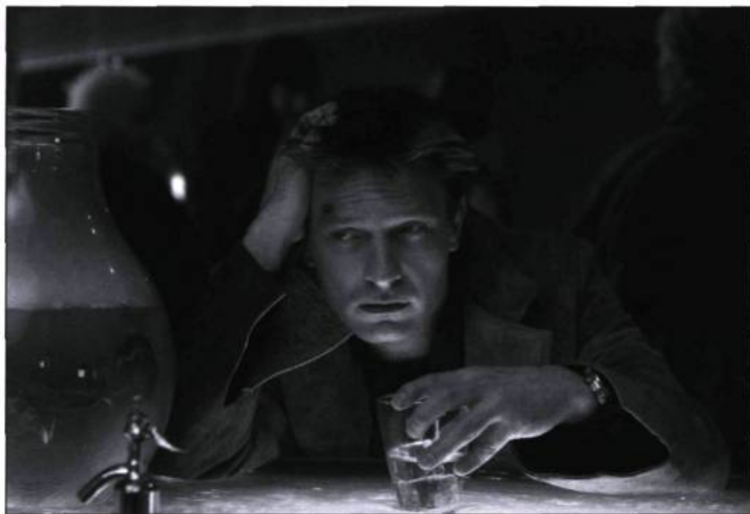
Nikopol noyant sa peine au Tykho Bar, un établissement fréquenté par les mutants et les extraterrestres

Nonobstant le résultat, quel est, de toute façon, l'intérêt de mélanger des personnages de synthèse et de véritables acteurs?