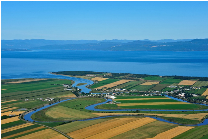
La rivière Ouelle, dans le Bas-Saint-Laurent

J'ai déjà mentionné mon affection pour la vallée de la Jacques-Cartier. J'ai aussi une préférence pour la rivière Ouelle, dans la région de Kamouraska. Selon moi, il s'agit d'un exemple exceptionnel de symbiose entre l'humain et la nature. On y remarque le fleuve, la rivière, les parcelles agricoles, les bâtiments de fermes, les habitations, le tout dans une harmonie paysagère hors du commun.