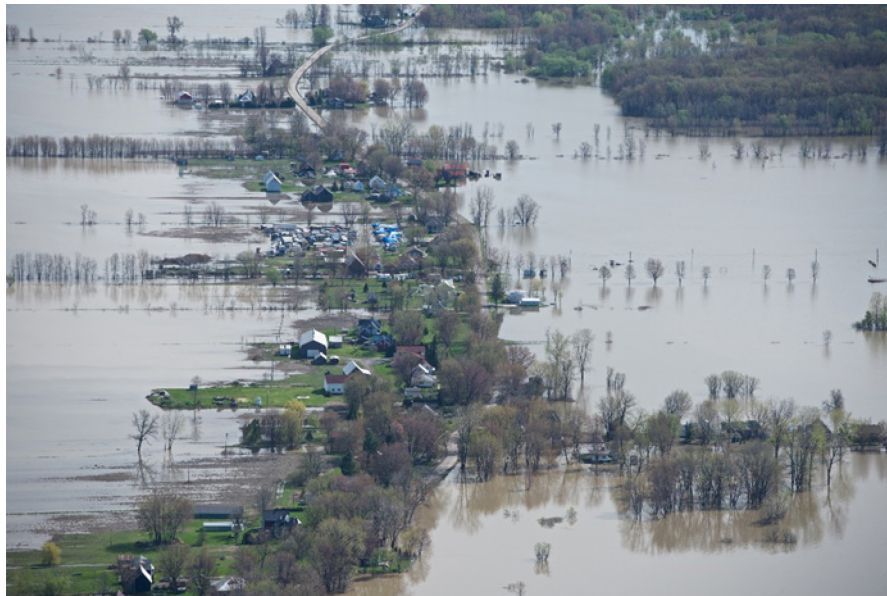
Inondations en bordure du lac Saint-Pierre, en Mauricie

système seigneurial dans la vallée du Saint-Laurent, c'est-à-dire les longs lots rectangulaires et les villages linéaires. Il y a aussi le phénomène d'érosion des berges aux Îles-de-la-Madeleine, en Gaspésie ou sur la Côte-Nord qui m'inquiète. De plus, la récurrence plus fréquente des inondations m'interpelle. Je tente de couvrir ces phénomènes géographiques, car ces transformations doivent être documentées en vue de la sensibilisation des populations et de possibles interventions.