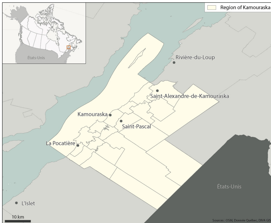
Carte 1 - Localisation de la MRC de Kamouraska

Nous nous basons sur des données collectées entre 2018 et 2020 auprès de parties prenantes à la démarche locale d'ÉC dans la MRC de Kamouraska, dans la région du Bas-Saint-Laurent, au Québec (voir carte 1).