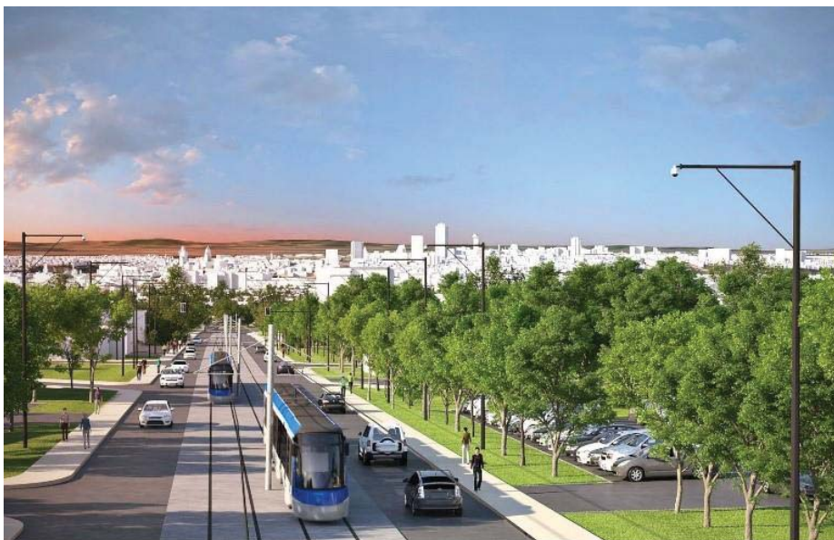
Figure 4 – Simulation d'un tramway dans le secteur de Charlesbourg

Le projet est accueilli très favorablement par le maire de l'époque, Jean-Paul L'Allier. Toutefois, en ces années intenses de gestion administrative et politique du regroupement municipal, le projet ne sera pas lancé (Béland, 2017). En 2005, la nouvelle mairesse issue de la banlieue, Andrée Boucher, se montrera réticente au projet, qu'elle qualifie de « rêve » peu avant son décès (Porter, 2018a). Son successeur en 2007, Régis Labeaume, tiendra des propos ambigus par rapport au tramway au cours des 12 années suivantes, appuyant et rejetant en alternance l'idée, notamment pour des questions de financement et à la suite des désaccords sur les tracés possibles.