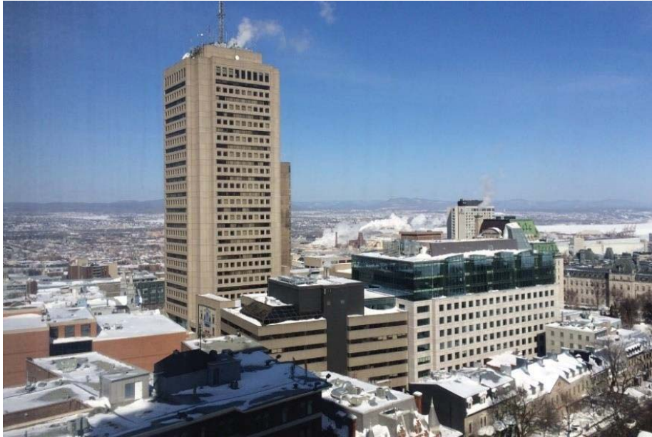
Figure 1 – L'édifice Marie-Guyard, aussi appelé le Complexe G

Son homogénéité ethnique, son conservatisme et son ancrage dans le Québec profond lui ont valu le surnom de « Vieille Capitale », une image qui contraste avec celle de Montréal, métropole cosmopolite manifestement intégrée à la modernité nord-américaine (Racine et Villeneuve, 1992). Cette image patrimoniale de Québec serait en partie surfaite, considérant la modernisation des années d'après-guerre selon le trio voiture-bungalow-centre commercial (Mercier, 2010). D'autres vont jusqu'à dire que le Vieux-Québec est une sorte de Disneyland entouré d'une marée de pavillons de banlieue (Geronimi, 2008). Faut-il se surprendre qu'une copie du Vieux-Québec sera conçue en Chine, à proximité de Shanghai, en 2022 (Siou, 2017)? L'original et la future copie soulèvent paradoxalement tous deux des interrogations en matière d'authenticité.