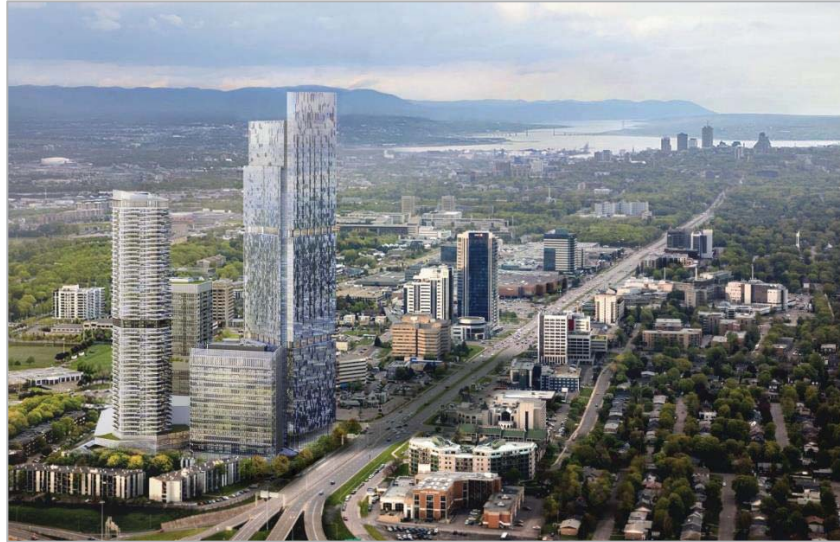
Figure 6 – Esquisse du projet Le Phare de Québec

Fonds de placement immobilier Cominar, veut construire le plus haut édifice canadien à l'est de Toronto, soit un ensemble comprenant des commerces, des bureaux et des logements répartis sur trois tours, dont la principale devrait atteindre 65 étages d'une hauteur de 250 m. Le projet, perçu par certains comme démesuré, serait localisé dans le secteur de Sainte-Foy, près des accès aux ponts de Québec et Pierre-Laporte (voir figure 6).