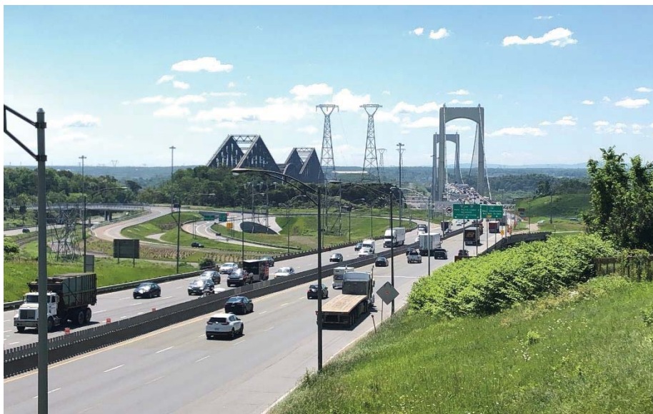
Figure 5 – Les ponts de Québec et Pierre-Laporte (vue du nord vers le sud)

L'idée d'un 3 e lien interrives à Québec circule depuis près de 15 ans. Elle est notamment discutée abondamment sur les ondes des stations de radio régionales. Cet intérêt découle de l'augmentation notable de la circulation routière à Québec depuis le début des années 2000 (Pelchat, 2009). Il faut garder en mémoire le fait que Québec présente un fort taux de motorisation. De plus, selon Statistique Canada (2016b), 80,4 % de la population active de la RMR de Québec utilisait l'automobile, un camion léger ou une fourgonnette pour ses déplacements quotidiens, en 2016 11 . La Coalition avenir Québec (CAQ) prend position en faveur du projet de 3 e lien lors de l'élection provinciale de 2014 et le Parti libéral du Québec en fait autant en 2017, en plus de procéder à la mise en place d'un « Bureau de projet » pour évaluer la faisabilité des multiples options d'aménagement (Borde, 2017).