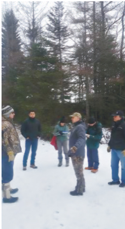
Figure 3 Visite du territoire de la famille Kanapé, réalisée dans le cadre des consultations sur les plans d'aménagement forestier sur le Nitassinan