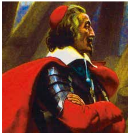
Le cardinal de Richelieu

Le comte de Moret/Le Sphinx rouge , II, 11, p. 244.